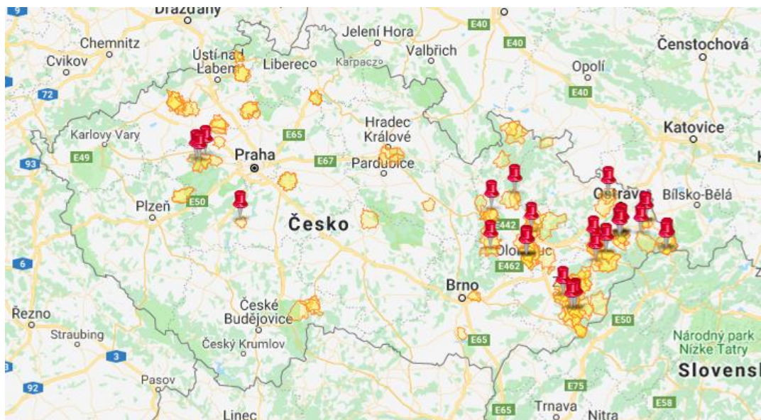
Stav ke dni 30. 6. 2018