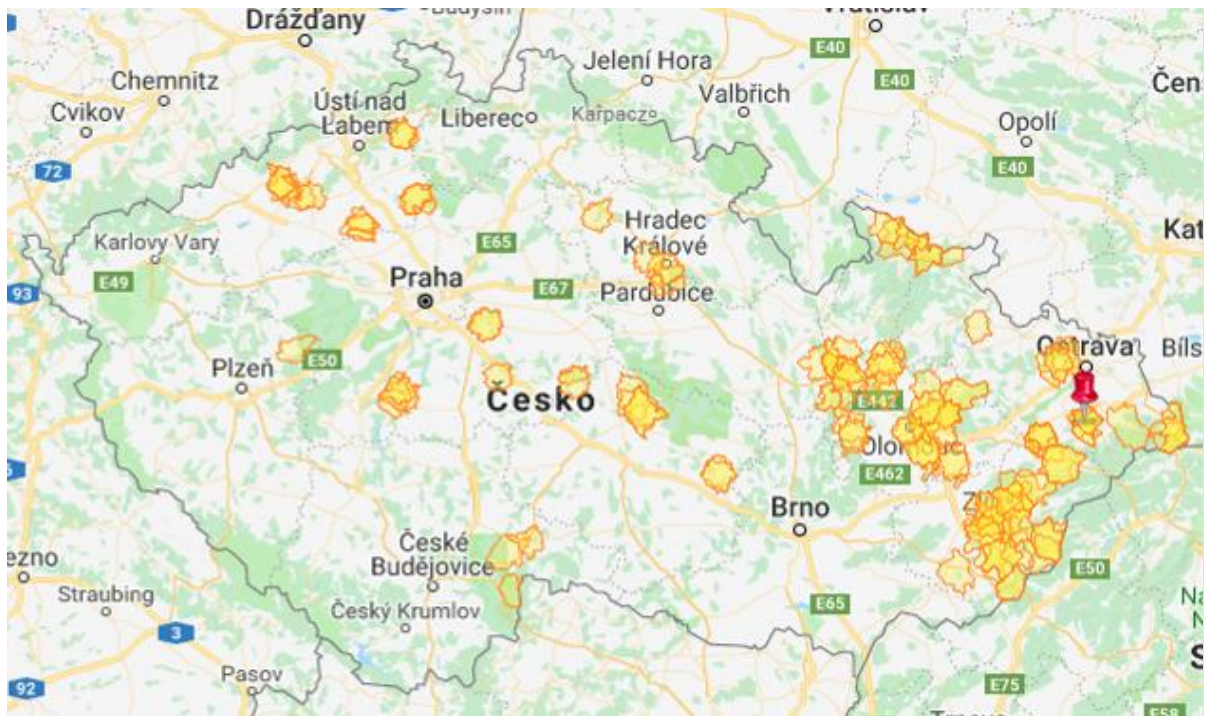
Stav ke dni 15. 2. 2018