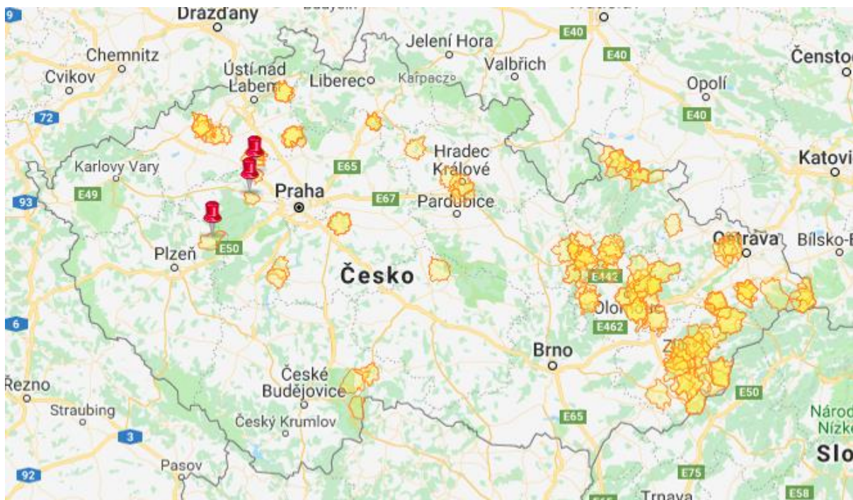
Stav ke dni 15. 4. 2018